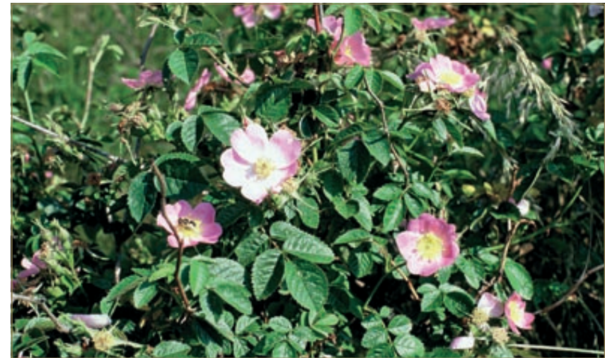
Een bloeiende egelantier is duidelijk te herkennen aan de dieproze gekleurde bloemen.

bare nakomelingen vormen. In deze spontane hybriden zijn zowel soortspecifieke kenmerken te herkennen afkomstig van de oudersoorten als nieuwe en intermediaire vormen. Het voorkomen van zowel soortspecifieke als atypische kenmerken binnen een zelfde individu bemoeilijkt de identificatie van deze spontane hybriden.