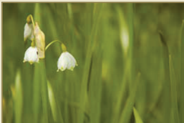
Zomerklokjes: uiterst zeldzaam!

We steken de brug over de Kleine Nete over en kiezen direct erna het pad rechts van de brug naar beneden (Bollaakdijk). We gaan de brug links onderdoor, draaien direct na de brug links en steken de beek Bollaak over. We gaan onmiddellijk rechts het onverharde pad op dat parallel met de Bollaakbeek loopt. Hier lopen we langs de rand van het Zomerklokje, een klein natuurgebiedje met ruige moerasvegetatie, tussen de Kleine Nete en het Netekanaal. Aangekomen aan de sluis op de beek, kiezen we de uiterst linkse weg naar beneden. Het natuurgebied mag dan uiterst klein zijn, we