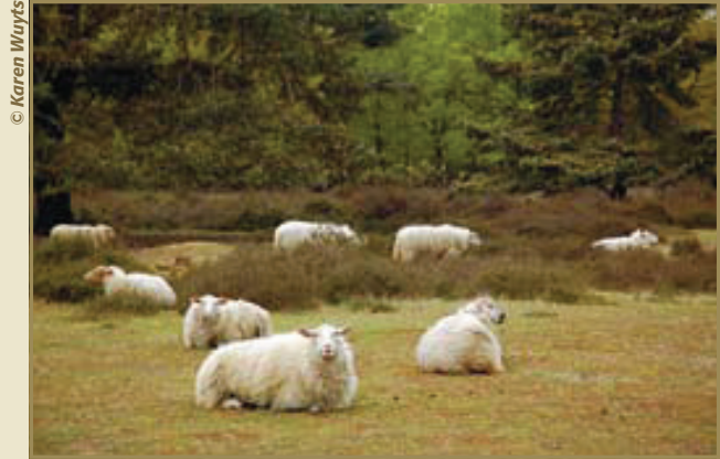
De schapen van de Kesselse heide.

Waar het straatje achter 'het Badhuis' kruist met de grote baan fietsen we het zandpaadje in (rechts van de hondenschool). We duiken hier het bos in en houden rechts aan. Weer uit het bos draaien we links de weg op. Aan de T-splitsing gaan we links en onmiddellijk weer rechts. De eerste straat aan de rechterzijde rijden we in en we fietsen reeds langs het provinciaal domein 'Kesselse Heide'. Om onze fiets te kunnen stallen, volgen we de weg tot aan het onthaalcentrum. Aan de grote baan gaan we links en draaien 100 m verderop de parking van het domein op. Hier starten we onze wandeling doorheen de Kes-