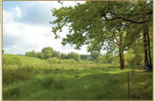
Vloeibeemden: door bevloeiing werden deze arme gronden vruchtbaarder gemaakt

vinden hier wel een populatie van het uiterst zeldzame en bedreigde Zomerklokje. Het is de op één na enige plek in Vlaanderen waar we dit mooie bloempje nog kunnen terugvinden.