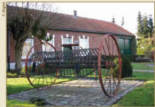
Het Ernest Claeshuis is nu een museum.

In ons verstedelijkte landschap zijn riviervalleien parels van de natuur. De Demervallei tussen Diest en Aarschot is als grote aaneengesloten groene open ruimte één van de meest waardevolle valleien in Vlaanderen. In de driehoek Testelt-Averbode-Zichem is de vallei op zijn breedst. De ligging tussen de zandige Kempen in het noorden en het leemachtige Hageland in het zuiden draagt bij tot het unieke karakter van de streek. Het oorspronkelijke landschap van moerassen en wilgenstruwelen werd al sinds de prehistorie meer en meer ontgonnen tot een lappendeken van hooiland en turfputten. In de tweede helft van de negentiende eeuw waren de Zichemse beemden één van de grote hooileveranciers voor de ruitery in Brussel en andere steden. Door de opkomst van koning auto in de twintigste eeuw verloor het paard stilaan aan belang als krachtbron en verdween dus ook de behoefte aan massale hoeveelheden hooi. Grote delen van de Demervallei werden dan ook beplant met populieren. Elzen en wilgen koloniseerden de resterende gronden. Sinds 1987 herstelde Natuurpunt op enkele percelen het hooilandbeheer. Daarbij zoeken ze een evenwicht tussen hooiland en waardevolle broekbossen om tot een zo maximaal mogelijke biodiversiteit te komen.