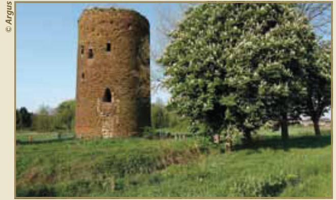
De Maagdentoren, een historische zeldzaamheid voor Vlaanderen.

Keer terug naar knooppunt 59, waar de Oude Demer de Ernest Claesstraat kruist. Daar ga je linksaf, richting knooppunt 57. Net voor de