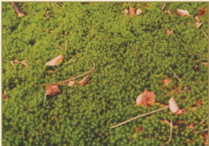
Volle mostapijten in de heemtuin: voor blinden een fantastische ‘voelervaring’.