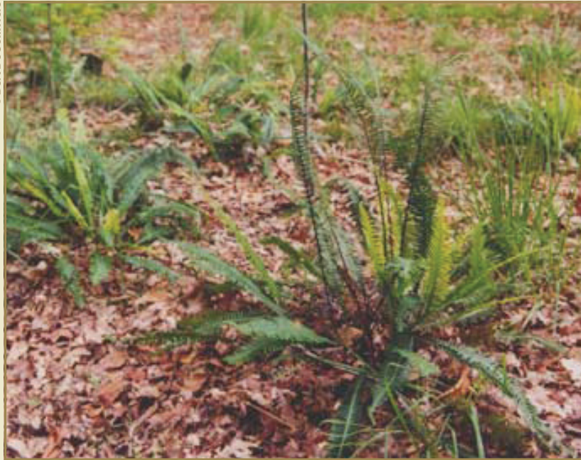
Een opvallende aanwezige in de ondergroei is de varensort Dubbelloof

Ryckvelde bevindt zich op de grens van Damme, Brugge en Beernem en ligt grotendeels op het grondgebied van Sijsele, een deelgemeente van Damme. Je kan deze wandeling (6,4 km) op verscheidene plaatsen starten. Er bevinden zich parkeerplaatsen in het straatje Vossenbergh (een zijstraat van de Ng Maalsesteenweg tussen Sijsele en Brugge), aan het kasteel van Ryckvelde zelf, aan de heemtuin in het bos (voor mensen met een beperkte mobiliteit) of ter hoogte van het Natuurreservaat Schobbejakshoogte. De wandeling is aangeduid met provinciale bordjes. Een bezoek aan de heemtuin is mogelijk voor mensen met een beperkte mobiliteit, en ook voor blinden is er de nodige infrastructuur aangebracht. Deze wandelroute werd uitgewerkt door het ANB West-Vlaanderen.