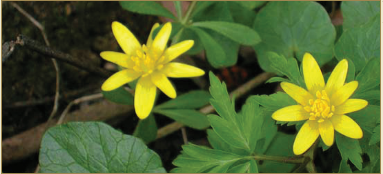
De bossen worden in het voorjaar door o.m. speenkruid gekleurd.

We komen aan bij de hoeve Scheyvaerts. De eerste sporen van menselijke aanwezigheid hier dateren uit de periode van de indijking van de Rupel. Op de ontstane hooilanden in dit gebied graasden toen honderden stuks vee. Vandaag is de hoeve het centrale ontmoetingspunt van het gebied, waar sanitaire voorzieningen, picknickplaatsen, een blokhut (op aanvraag te gebruiken bij slecht weer) en een speelweide te vinden zijn. Het geheel wordt aangevuld met een omheinde boomgaard met allerlei kleine huisdieren en een boswachterswoning.